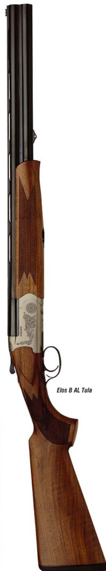
Elos B AL Tula

Βέβαια, το όπλο που διέθεσε σε εμάς ο αντιπρόσωπος ήταν συγκεκριμένων κυνηγετικών προδιαγραφών. Επρόκειτο για το ELOS/TULA ή έκδοση του ELOS που προορίζεται για το κυνήγι ορτυκιού και μπεκάτσας. Η πλήρης ονομασία του συγκεκριμένου όπλου είναι ELOS B-AL/TULA, διότι είναι η ελαφριά έκδοση, βάρους 2.700 γρ., που νομίζεις ότι είναι ένα 20αρι σούπερποζέ με διαστάσεις 12αρι. Αυτή βέβαια η σημαντική μείωση του βάρους στα 2.700 γρ., οφείλεται κατά πρώτον στην ελαφριά