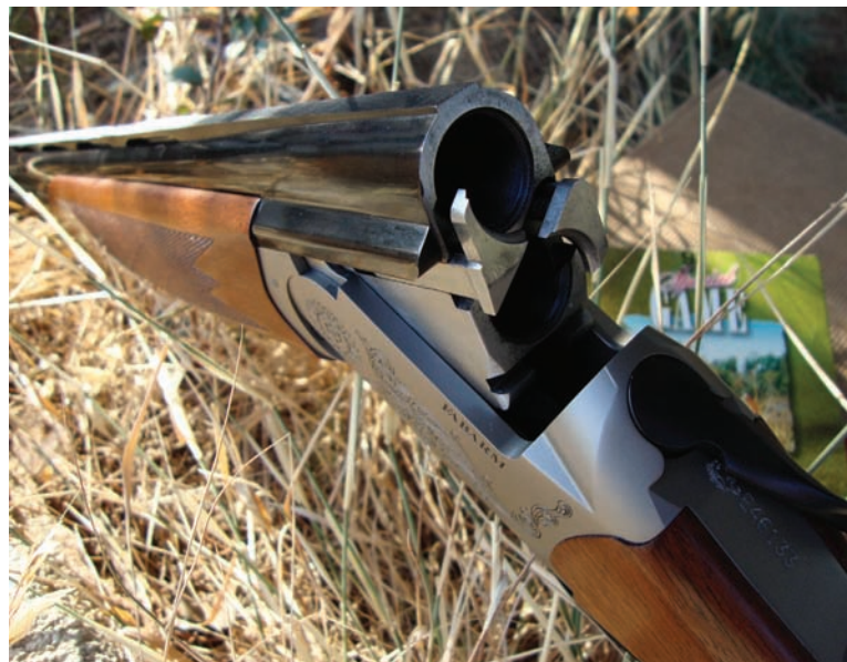
Οι αυτόματοι εξολκείς είναι πολύ καλά συγχρονισμένοι και βέβαιο το μήκος των θαλαμών 3 ιντσών μάγκνουμ (76 χιλ.).

βάση από κράμα αλουμινίου ERGAL-SS και κατά δεύτερον στις κοντές κάννες μήκους 61 εκ.