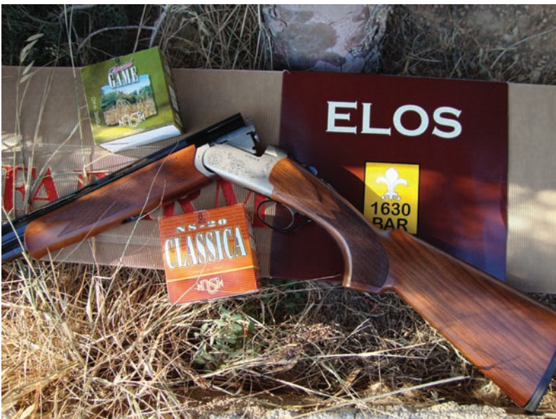
Ξανασχεδιασμένη βάση και όμορφα ξύλα από καρυδιά.