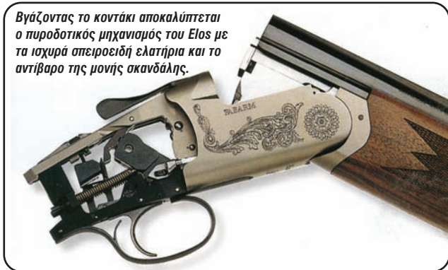
Βγάζοντας το κοντάκι αποκαλύπτεται ο πυροδοτικός μηχανισμός του Elos με τα ισχυρά σπειροειδή ελατήρια και το αντίβαρο της μονής σκανδάλης.

χές. Σε αυτό βέβαια συντελεί και ο συνδυασμός των κλειδιών του, καθώς έρχονται οι κάννες και δένουν με τη βάση στους δύο διακεκομμένους πύρους μπροστά και στο ατσάλινο συρτάρι πίσω, πλάτους 29,7 χιλ.