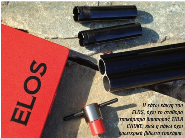
Η κάτω κάννη του ELOS, έχει το σταθερό τσοκάρισμα διασποράς TULA CHOKE, ενώ η πάνω έχει εσωτερικά βιδωτά τσοκάκια.