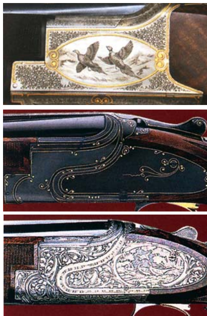
Οι εκδόσεις του B-25 με κάποιες από τις βαθμίδες σκαλισμάτων και φινιρίσματος που μπορεί κάποιος να παραγγείλει.

με πολλές εργατώρες χειροποίητης δουλειάς, με βελγικές πρώτες ύλες, ήταν πλέον δύσκολο να πωλείται σε προσιτή τιμή. Αρκεί να αναφέρω μερικές από τις τεχνικές λεπτομέρειες που συνθέτουν την κατασκευή ενός B-25, όπως ότι αποτελείται από 84 μέρη κατασκευασμένα από 22 διαφορετικά κράματα ατσαλιού, τα οποία επιτελούν 794 διαφορετικές ακριβείς λειτουργίες. 67 μέρη του όπλου έχουν υποστεί διαφορετική θερμική κατεργασία, ενώ 155 χειροποίητες εργασίες που εμπλέκονται στην κατασκευή απαιτούν 2.310 (!) διαφορετικούς ελέγχους και μετρήσεις από 1.490 όργανα και κατασκευαστικά εργαλεία. Μια λοιπόν κουραστική και πολυέξοδη κατασκευή που ακόμη και σήμερα αποτελεί εφιάλτη για έναν αδαή σπλουργό που επιχειρεί να "βάλει χέρι" σε ένα τέτοιο σούπερ ποζέ.