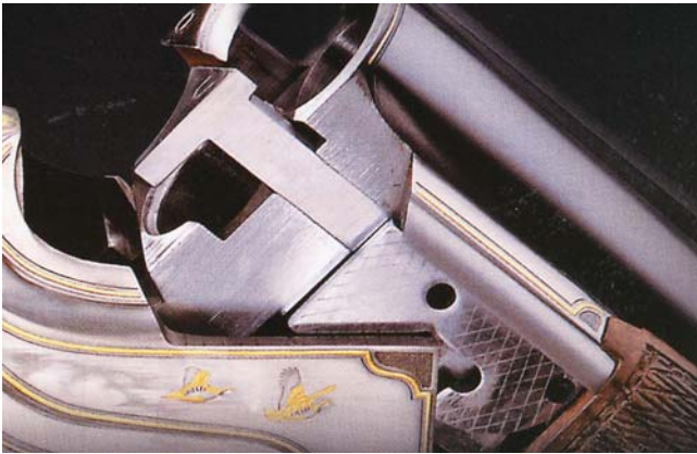
Οι αυτόματοι εξολκείς έχουν πάνω τους τα γράμματα "Ο" και "Υ" ώστε αν αντικατασταθούν να φαίνεται ότι δεν είναι της "μάνας" τους.