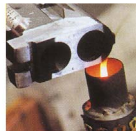
Οι χειροποίητες εργασίες στο custom shop πάνω σε ένα B-25 την ώρα που κατασκευάζεται.